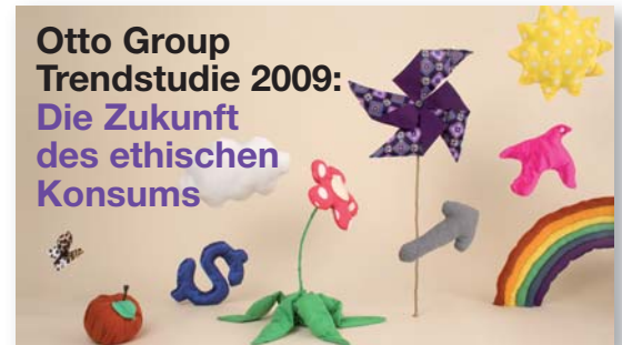
Studie des Trendbüros Hamburg

Massenmärkten entsprechen. Es gilt, hier verstärkt weiterzuentwickeln, um einen größeren Effekt zu erzielen.“